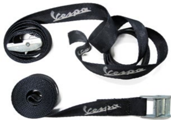
CINGHIE FISSAGGIO BAGAGLI Luggage belts cod. 605511M

The "Elegance" graphics kit was conceived to let owners enhance the looks of their Vespa quickly and easily. Consists of decals applied to the front shield and flanks.