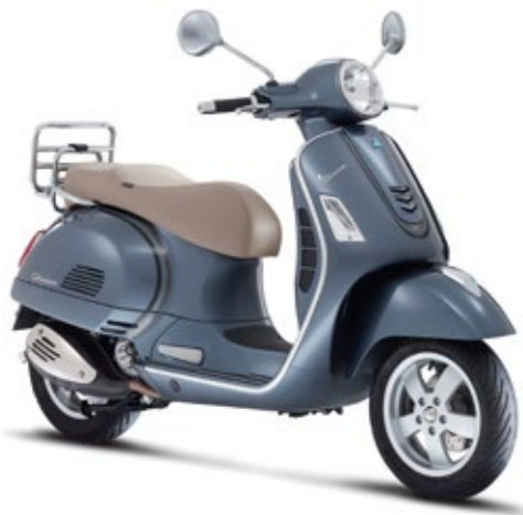
GRAFICHE "ELEGANCE" - ANTRACITE/NERO "Elegance" stickers - Dark gray/Black cod. 606079M0003

The "Elegance" graphics kit was conceived to let owners enhance the looks of their Vespa quickly and easily. Consists of decals applied to the front shield and flanks.