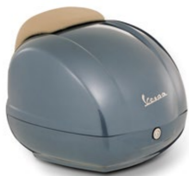
GRIGIO DOLOMITI cod. CM273337