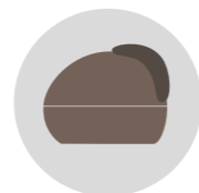
CRETA SENESE cod. CM273325