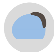
AZZURRO INCANTO cod. CM273339