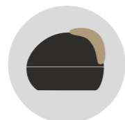
NERO VULCANO cod. CM273336