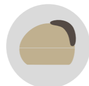
BEIGE ELEGANZA cod. CM273338