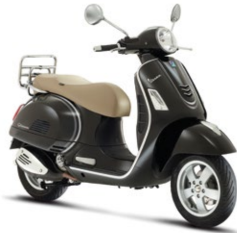
GRAFICHE "ELEGANCE" - ARGENTO/ANTRACITE "Elegance" stickers - Silver/Dark Grey cod. 606079M0002

The "Elegance" graphics kit was conceived to let owners enhance the looks of their Vespa quickly and easily. Consists of decals applied to the front shield and flanks.