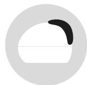
BIANCO INNOCENZA cod. CM273334