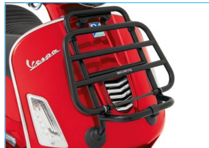
PORTAPACCHI ANTERIORE NERO Front rack black cod. 1B001484

A must-have Vespa accessory. The chromed rear luggage rack has always been a firm favourite among Vespa customers who want a unique and original accessory. The practical fold-down shelf offers excellent carrying capacity.