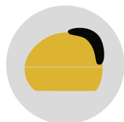
GIALLO GELOSIA cod. CM273341