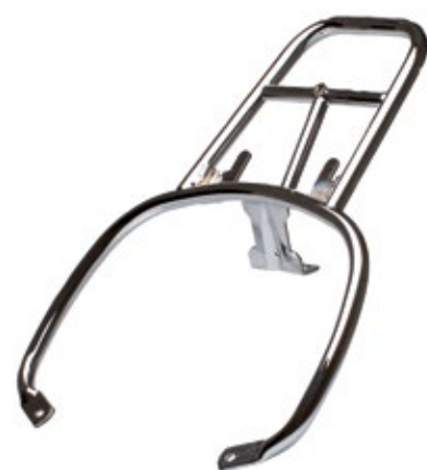
SUPPORTO BAULETTO CROMATO Top box chromed support cod. 657081

A kit offering protection for the bodywork against bumps and knocks while accentuating the looks of the Vespa GTS. Includes front luggage rack, rear outline guard and front mudguard bumper, all with chrome finish and Vespa logo.