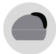
GRIGIO TITANIO cod. CM273342