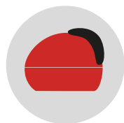
ROSSO PASSIONE cod. CM273335