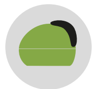
VERDE SPERANZA cod. CM273332