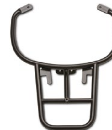
SUPPORTO BAULETTO NERO Black Top box support cod. 1B001909

Matte front luggage rack, which enhances carrying capacity while complementing the looks of the Vespa GTS Super.