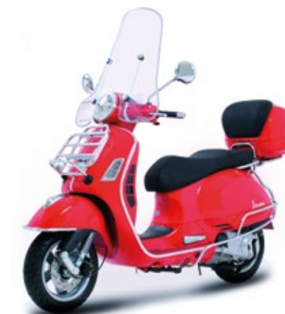
KIT PARTI CROMATE Chromed parts Kit cod. 602959M

Used in conjunction with the chromed rear luggage rack, this stylish accessory complements the looks of the Vespa and makes it even more unique.