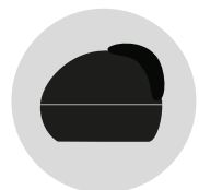
NERO LUCIDO cod. CM273333